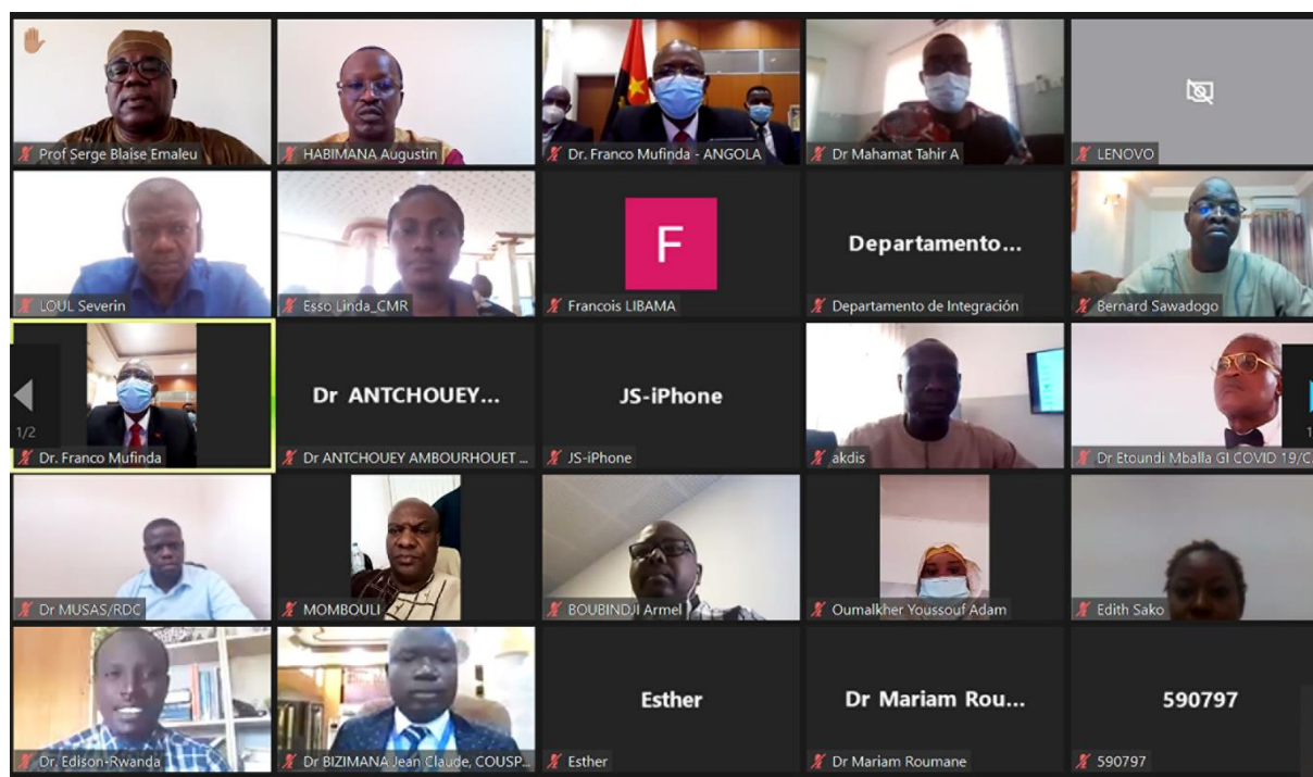
Participants à la réunion

Libreville, 12 avril 2022, Ce mardi, la Commission de la Communauté Economique des Etats de l'Afrique Centrale (CEEAC) à travers le Projet de Renforcement des Systèmes Régionaux de Surveillance des Maladies en Afrique Centrale, (REDISSE IV) a organisé une réunion par visioconférence, des Experts des ministères de la santé de ses onze (11) états membres. Cette réunion avait pour but d'échanger sur le niveau de mise en place et le fonctionnement des Centres des Operations d'Urgences de Santé Publique (COUSP) et de partager les leçons apprises et les bonnes pratiques issues de la riposte contre la COVID-19.